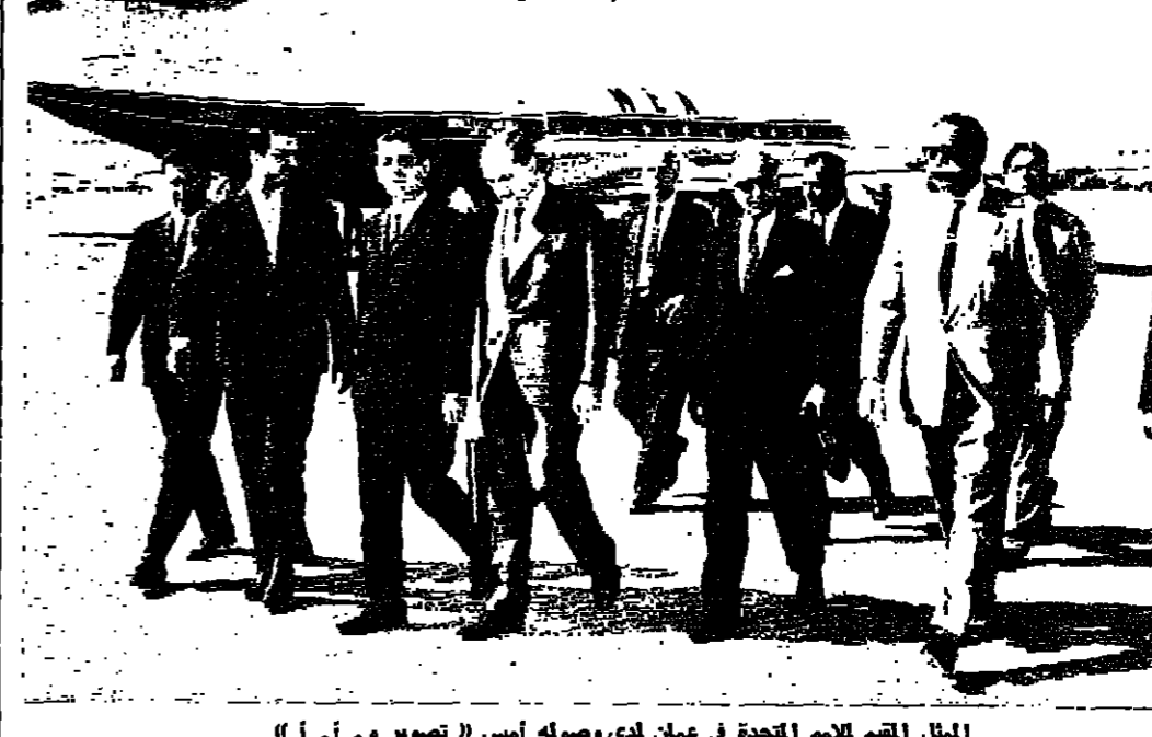
الممثل اليماني للمدة في عمان لدى وصوله امس « تصوير و. ا. ا »

صارخا ليدأ تقرير المصير الذي خاضل شعوب العالم في سبيله واضاف الدكتور غارسيا ان المقاومة بجميع اشكالها امر مشروع في نطاق القانون الدولي وهو لكل شعب يتعرض للعدوان او الاحتلال انتقاما من جدا تقرير المصير والنهوض من مطرة الاحتلال وتمتيز السيادة الوطنية واشار الدكتور غارسيا الى ان المسعود الصهيوني الذي وقع على الميثاق العربي في الخامس من حزيران عام ١٩٤٧ يشكل استورا للعدوان الاساسي الذي تعرض له الشعب الفلسطيني من قبل الصهيونية والشعب الفلسطيني الذي ناضل وكفاح في سبيل تحقيق استقلال بلاده وسيادتها